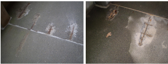
Sandblæst beton og armering.