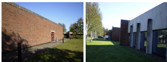
Afrensning af facader - Oksbøl