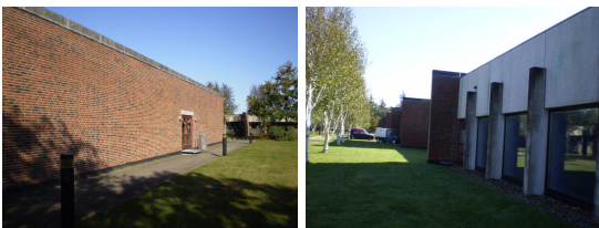
Afrensning af facader - Oksbøl