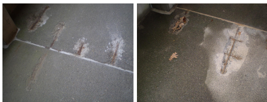
Sandblæst beton og armering.